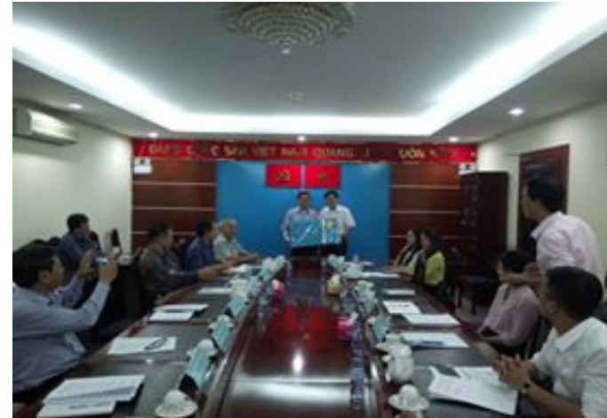
Hình 4. Làm việc với Sở Xây dựng TP. Hồ Chí Minh