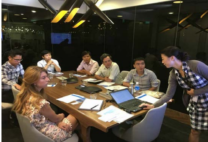
Hình 1. Làm việc với Chương trình 100RC (Singapore)