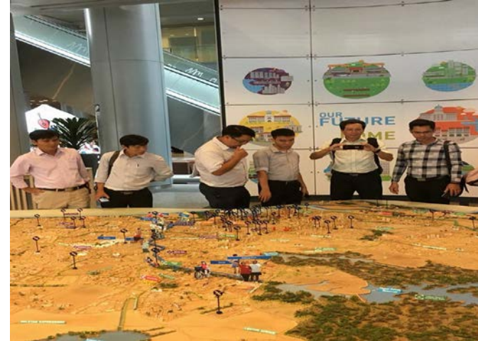
Hình 2. Tham quan Triển lãm Quy hoạch đô thị (Singapore)