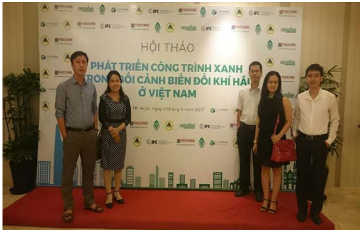
Hình 3. Tham dự Hội thảo Phát triển công trình xanh trong bối cảnh biến đổi khí hậu ở Việt Nam (TP. Hồ Chí Minh)